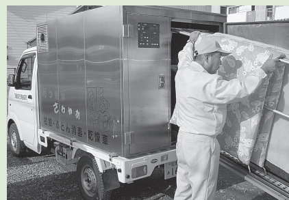
14名の皆様にご利用を頂きました

地域ささえあい 「ふとん乾燥・衛生」サービス 平成二十二年十一月一日(水)～三十一日(金)