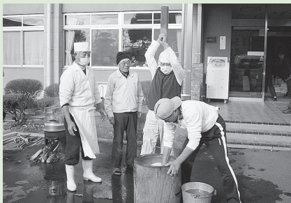
老福利用者さん有志 男四人衆