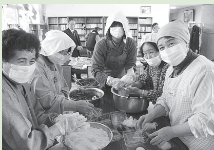
共催：ふくちゃんの会